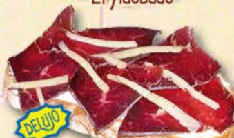
Ceeina de León