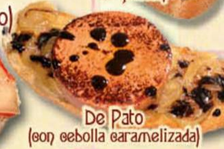
De Pato (con cebolla caramelizada)