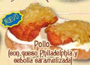
Pollo (con queso Philadelphia y cebolla caramelizada)