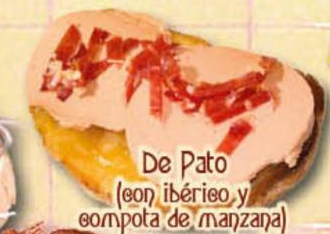
De Pato (con ibérico y compota de manzana)