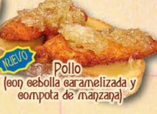
Pollo (con cebolla caramelizada y compota de manzana)